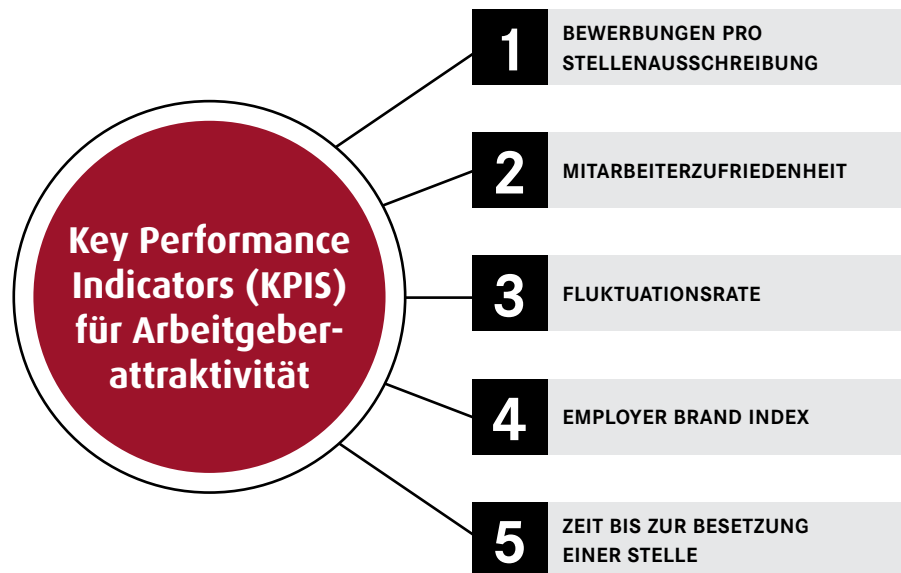
Abbildung: Key Performance Indicators für Arbeit- geberattraktivität